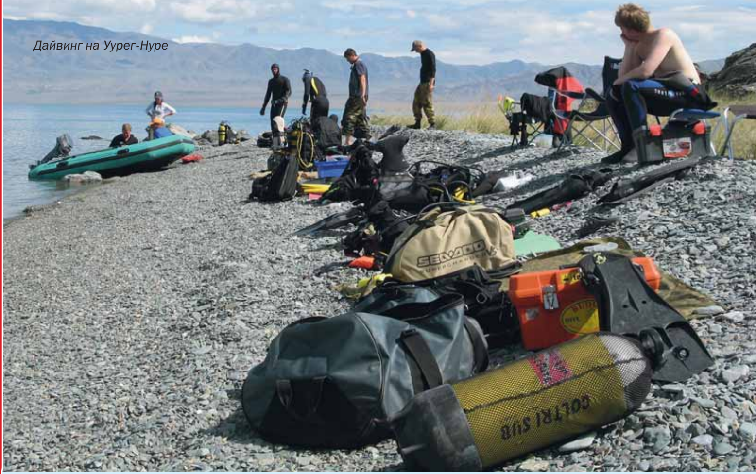
Дайвинг на Уурег-Нуре

Какой способ проснуться самый эффективный? Кофе, утренняя зарядка?