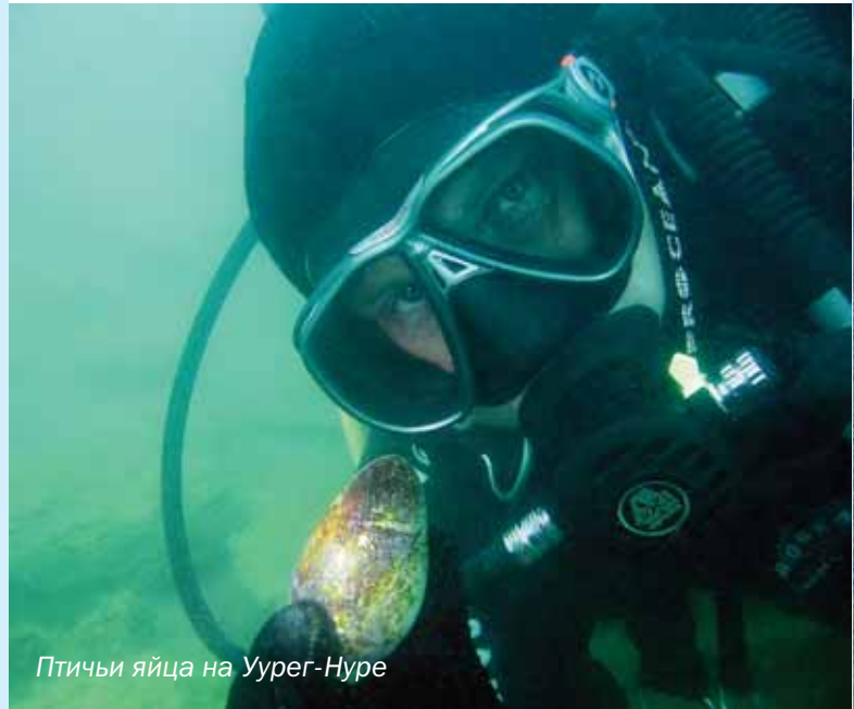
Птичьи яйца на Уурег-Нуре

Все меркнет в сравнении с запуском компрессора на высоте 2100 метров. Думаешь – или веревка стартера сейчас порвется, или рука отсохнет, или сейчас как возьму топор... И тут «хондюша», на 30-й попытке, чихнув, заводится. Еще 5 минут ей понадобится, чтобы набрать обороты и еще 50 минут, чтобы забить «пятнашку» с сотки до двухсот бар. Короче, катастрофа, если бы компрессор был один, или желания понырять было чуть меньше. А так – все нормально!