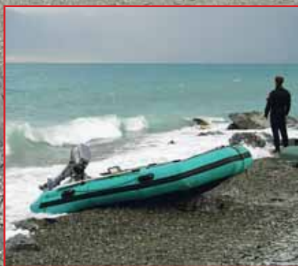
Стоянка на Уурэг-Нуре