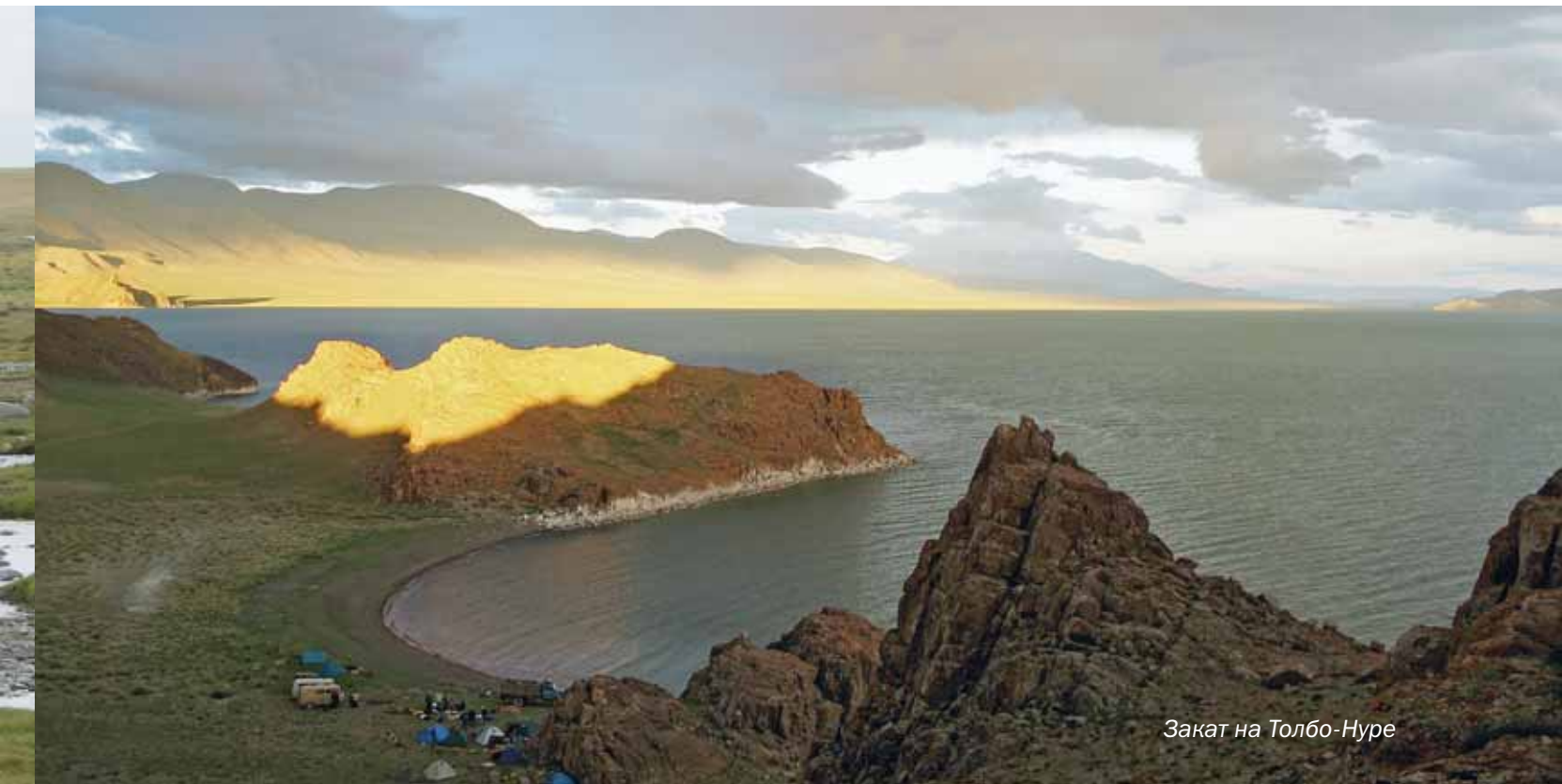
Закат на Толбо-Нуре

цы с Монголией, где должны были присоединиться еще два экипажа. Три года назад наш клуб уже проходил три четверти этой асфальтовой дистанции по трассе М52, когда в апреле мы решили добраться до закопанного в лед Телецкого озера с его южной, оттаявшей оконечности.