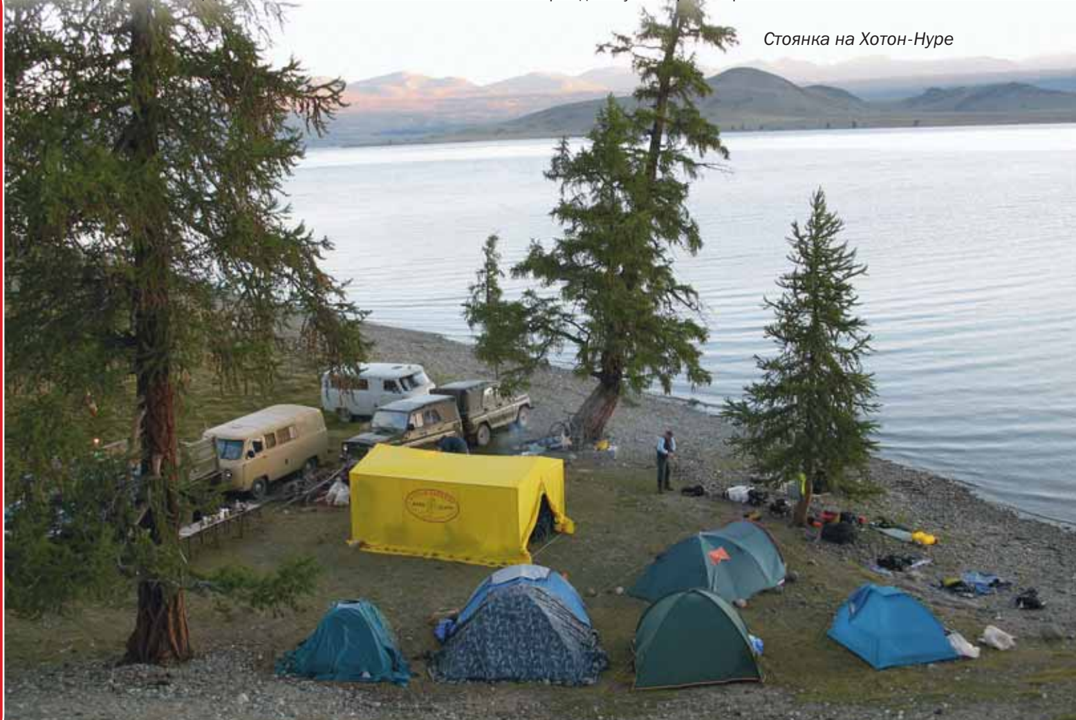
Стоянка на Хотон-Нуре

В первом же монгольском поселке меняем своих японских коней на местные «уазики», а снарягой забиваем с горкой бортовой «Зил». Выбор транспорта позже становится