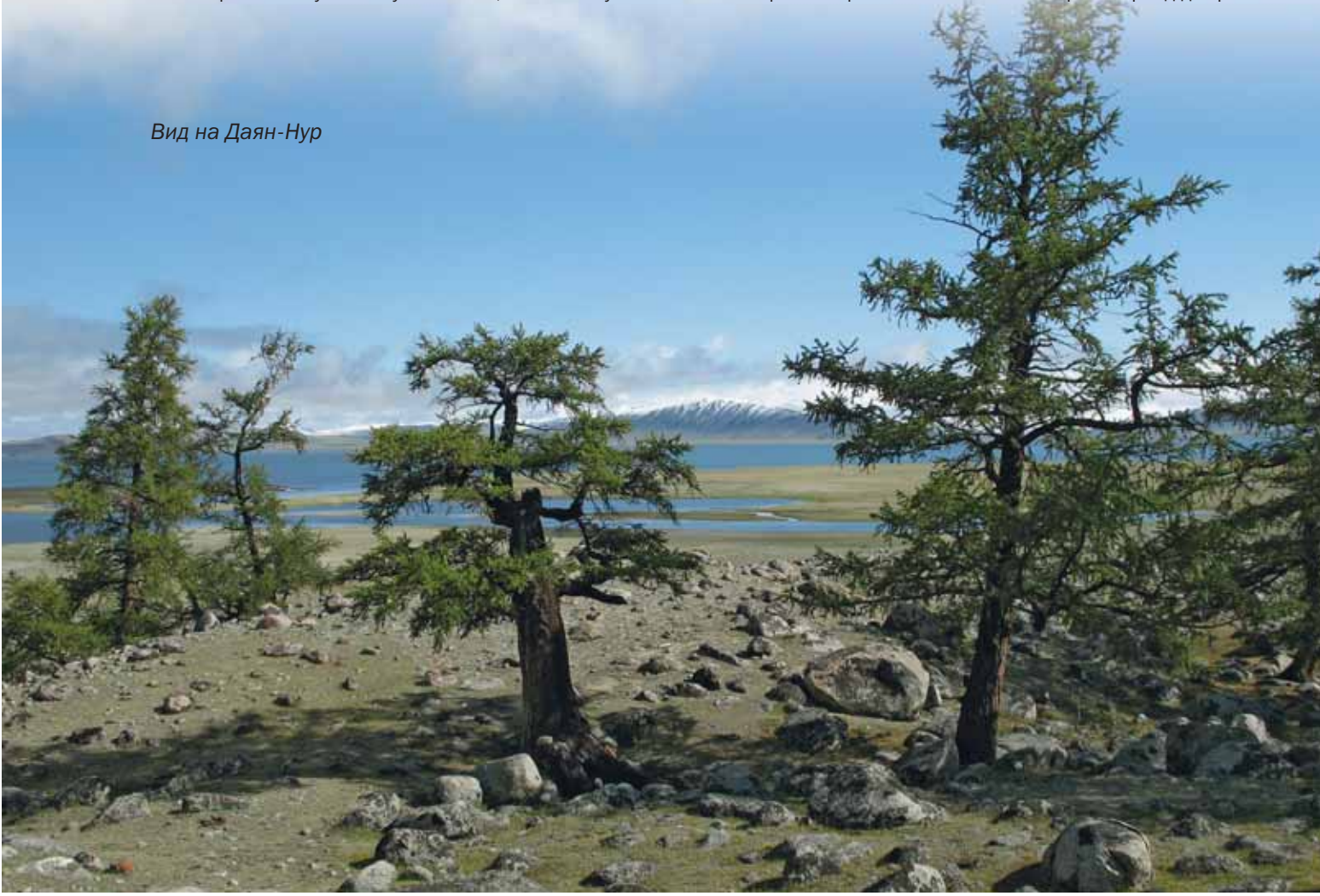
Вид на Даян-Нур

В назначенный августовский день колонна из семи машин двинулась в 1000-километровый рейд до грани-