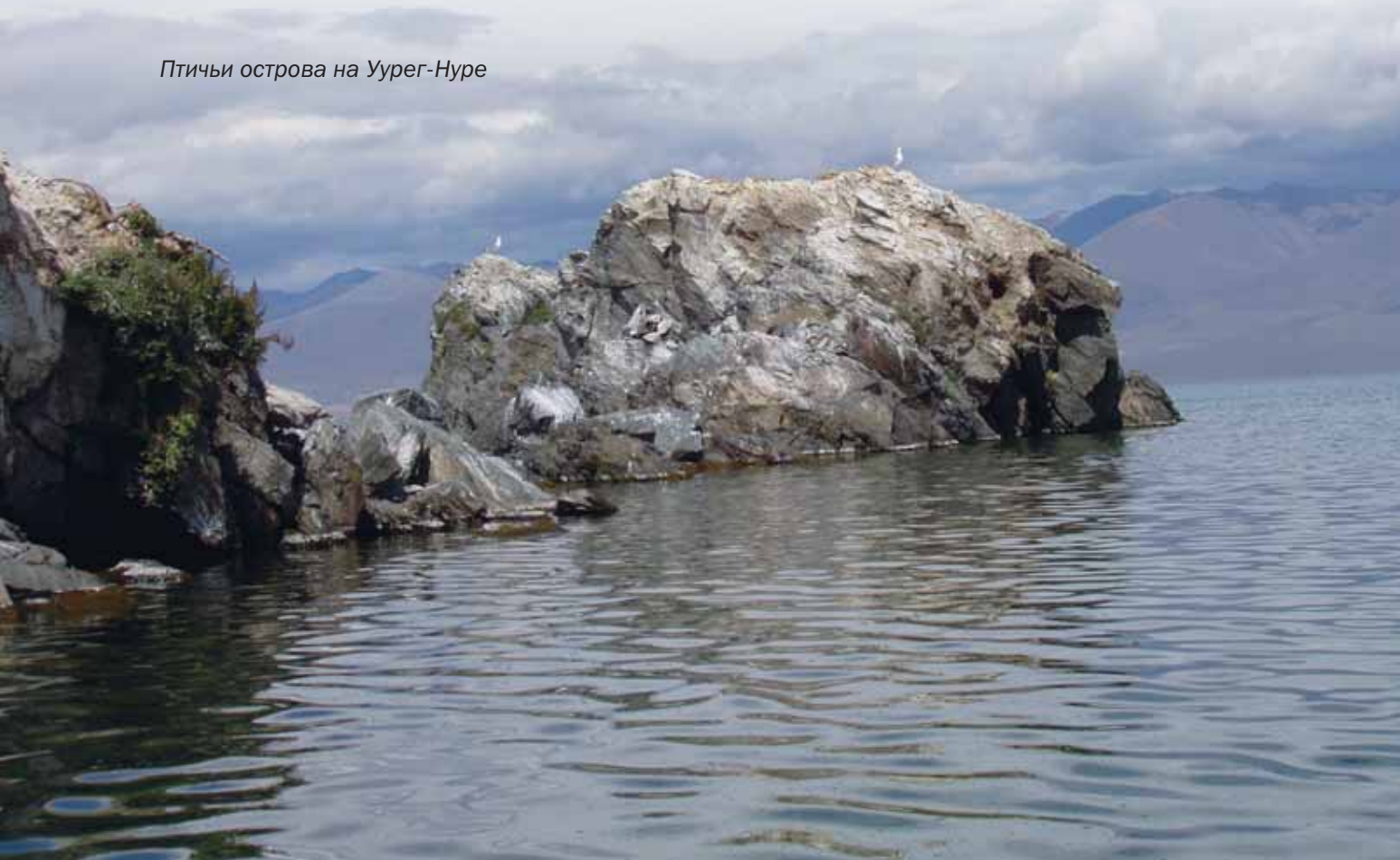
Птички острова на Уурег-Нуре

По прямой до Даяна около 90 км. Но в Монголии нет прямых дорог, поэтому едем по ущельям и вдоль хребтов все 180, периодически останавливаясь на перекур и перекус, штурмуя броды и деревянные мосты такого вида, что думаешь, лучше бы в брод. Средняя скорость по «жэпээске» 18 км/час радует только наших водителей. Говорят, когда воды больше, можно и сутки ехать. В такие рассказы верится легко, но думать о грустном не хочется. Добираемся до Даян-Нура к закату. Остается полчаса, чтобы