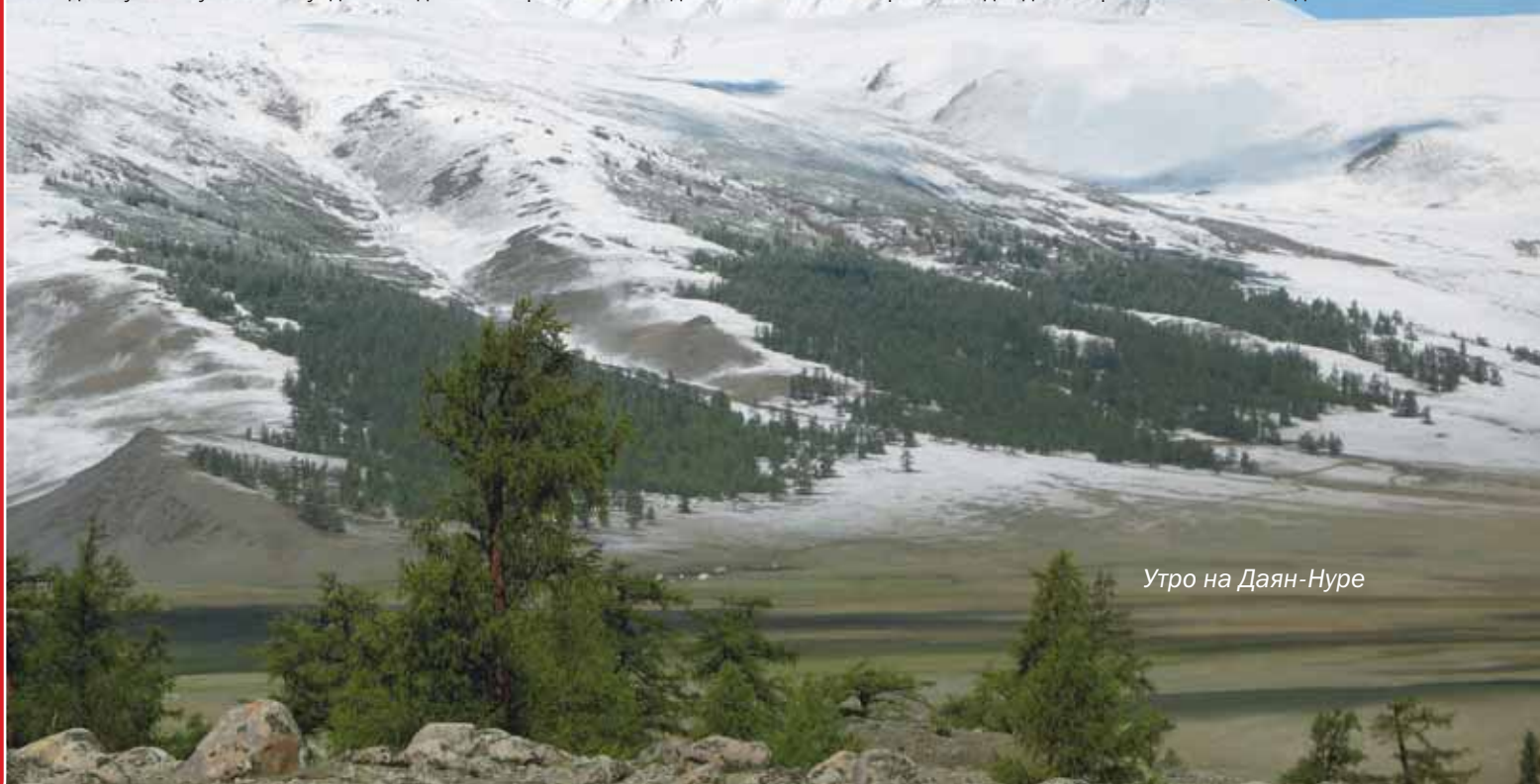
Утро на Даян-Нуре

Решаем, что основной маршрут – подводный хребет от мыса, где мы